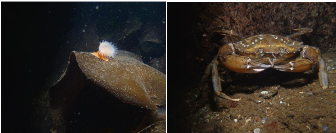
Øvrige beboere af vraget Pioneer